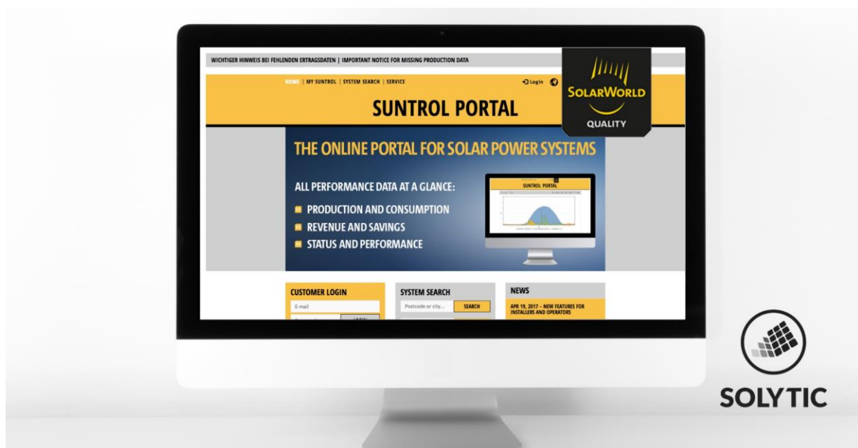
Bild 1: Ab 8. März 2019 übernimmt Solytic das Monitoring-Portal Suntrol von der insolventen Solarworld.

Solytic wurde 2017 in Berlin gegründet. Das 30-köpfige Unternehmen entwickelt intelligente Software für die technische Betriebsführung von Photovoltaikanlagen. Die kostengünstigen Lösungen des Unternehmens kommunizieren ertragsrelevante Fehler automatisch mittels eines Ticketsystems an die Anlagenbetreiber oder die Betriebsführer, um die optimale Leistung der PV-Systeme sicherzustellen. Durch diesen höheren Automatisierungsgrad reduziert Solytic die Kosten für Anlagenbetreiber und erhöht dank einer intelligenten Wartung die Anlagenenerträge. Darüber hinaus lassen sich mit der Software auch Betriebsberichte und Portfolio-Ansichten erstellen. Die herstellerunabhängige Lösung bietet mehrere Benutzeroberflächen, kann mit jeder Anlage verbunden werden und ist auch als White-Label-Lösung erhältlich.